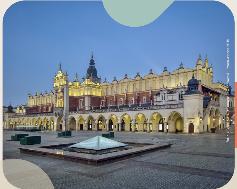
fol. : CC-BY-SA 4.0 Tomasz Lewandowski - Praca własna 2019

Po otwarciu granic i rynków światowych w latach 90tych, kamień przestał być dobrem lokalnym , a wielcy producenci, tacy jak Chiny, zalali rynek atrakcyjnym a przy okazji tanim surowcem.